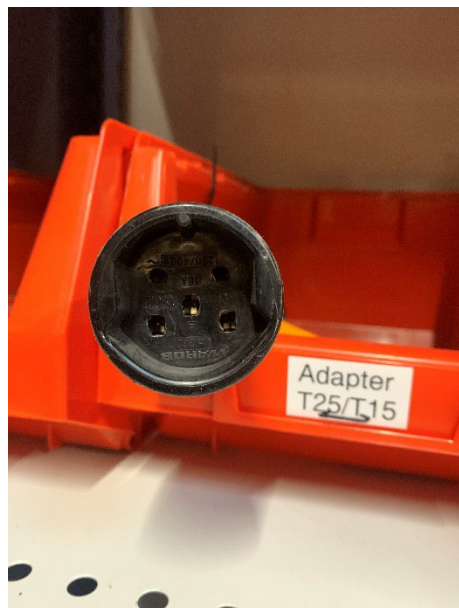
TYP 25 400 V